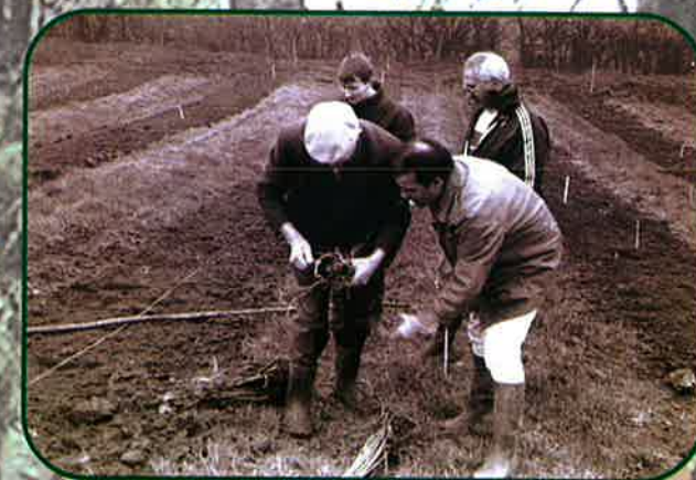
Plantation de l'Arboretum, janvier 1993