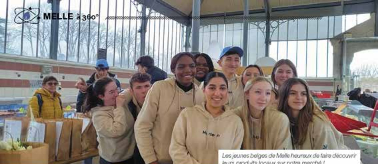
Les jeunes belges de Melle heureux de faire découvrir leurs produits locaux sur notre marché !