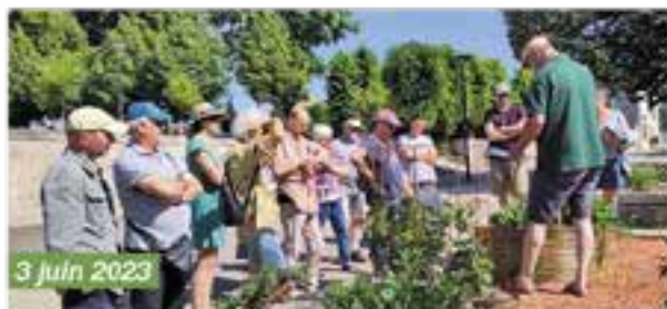
L'aventure du Vivant, les métiers grandeur Nature avec les élèves en 1 re année de BTS